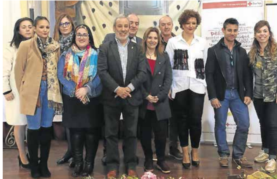
Representantes de Cruz Roja, del Ayuntamiento de Cuevas y de Vera

Hasta la fecha, se ha formado a casi un centenar de alumnos, los cuales han podido adquirir conocimientos en diversos ámbitos, además de tener la oportunidad de realizar prácticas no laborales en empresas colaboradoras, además de las cuevanas, a otras como Hoteles Playa-Hotel Zímbali, Best Oasis tropical, Best Mojácar, Apartamentos turísticos Best