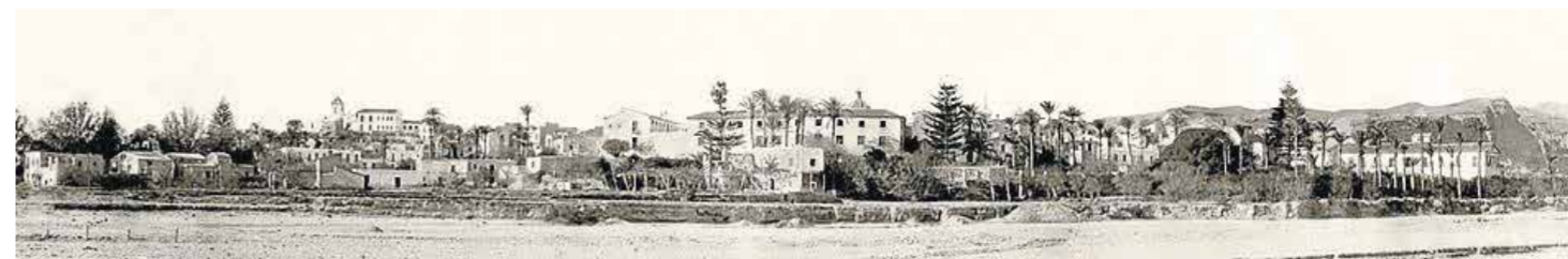
Panorámica de Cuevas en el primer tercio del siglo XX