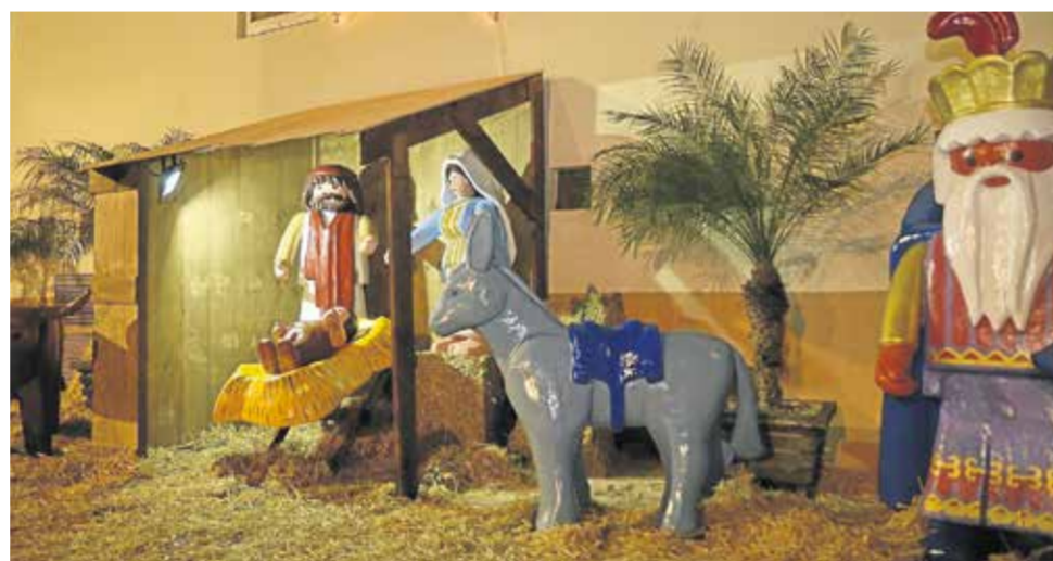
Belén de Playmobil en el Huerto García Alix / J. Guerrero