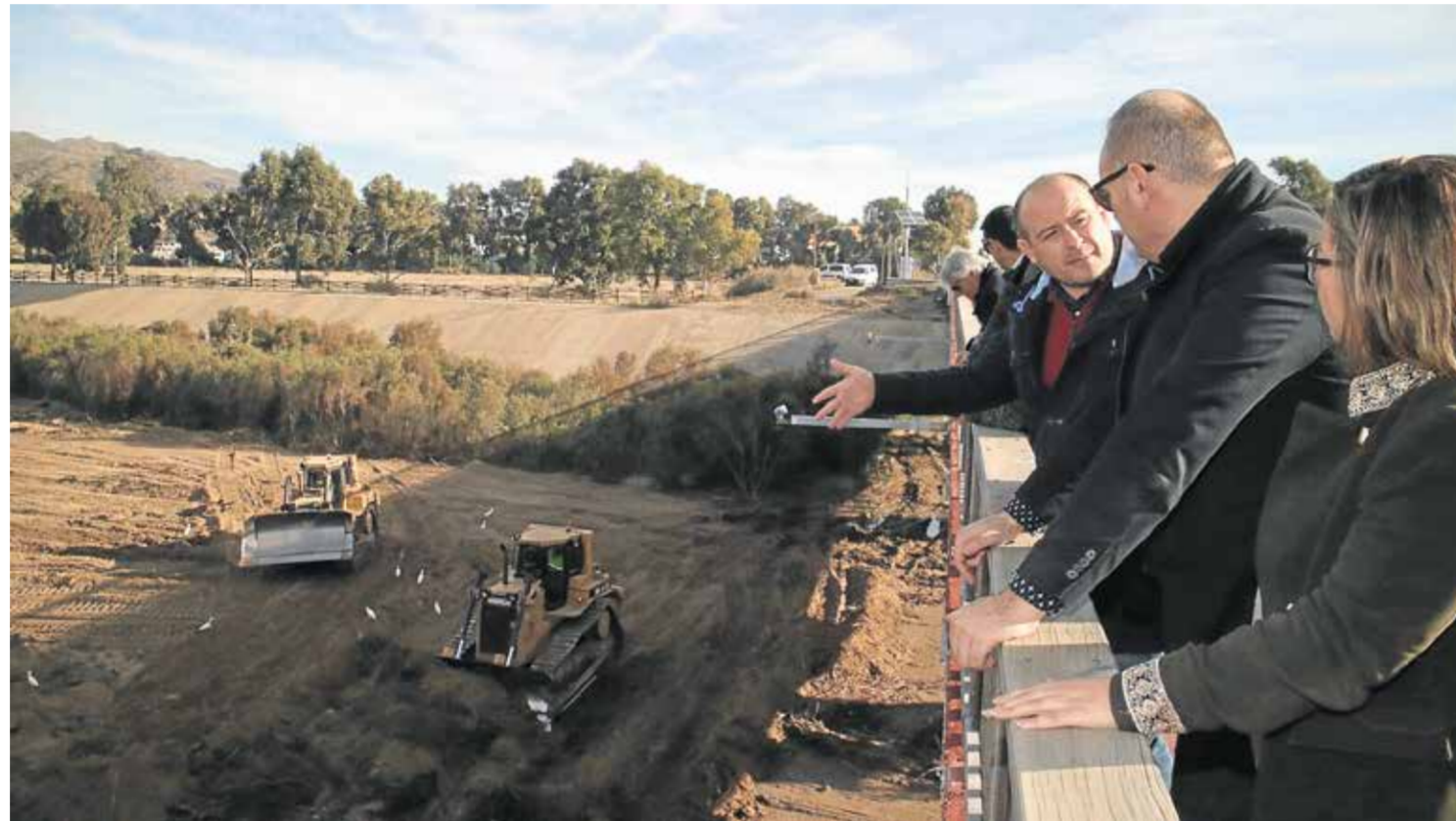
Trabajos de adecuación en la desembocadura del río Almanzora

Los trabajos se han ejecutado a lo largo de un kilómetro con el fin de eliminar los riesgos de derrame e inundación en la zona