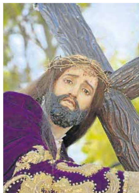
Jesús Nazareno