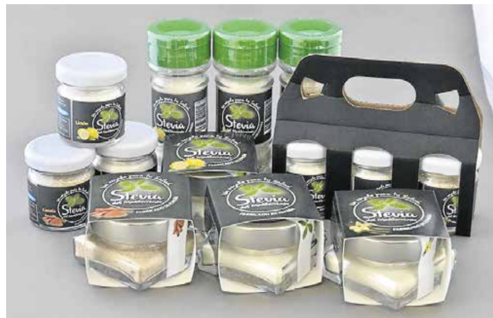
Productos de stevia de DNH Ecológicos

Andalucía Emprende, entidad dependiente de la Consejería de Economía y Conocimiento, celebrará el 11 de diciembre en el Hotel Barceló Renacimiento de Sevilla, la undécima edición del Día de la Persona Emprendedora (DPE) que este año, como novedad, pondrá su foco en la internacionalización y en las nuevas tecnologías como pilares fundamentales de la economía global, que contribuyen a paliar los obstáculos para emprender, garantizando la igualdad de oportunidades. Durante el DPE tendrá lugar la final de los IV Premios Andalucía Emprende, en la que participan las dos empresas ganadoras en la fase provincial NDH Ecológicos y Plásticos Maro, que optan a una agenda de negocios en un país