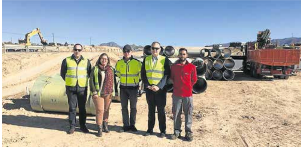
Visita a las obras de la A-332 en el tramo del polígono Los Pocicos