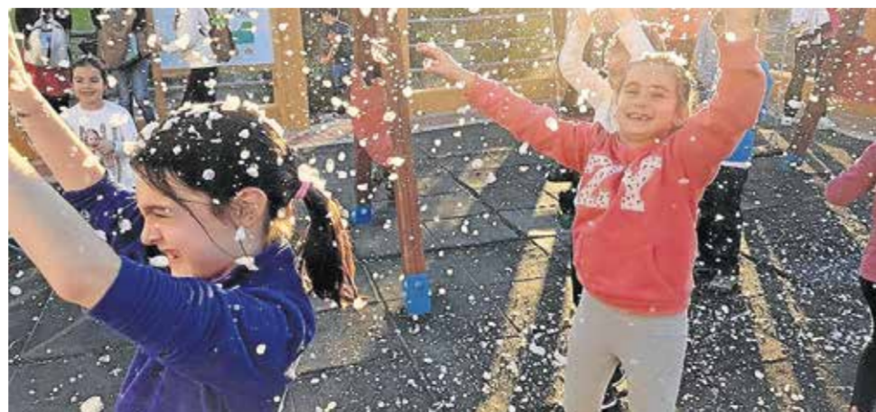
Los niños disfrutaron de la fiesta de la nieve