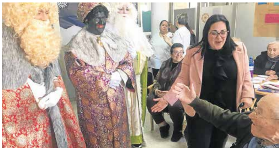
Los mayores se contagiaron de la magia de la Navidad