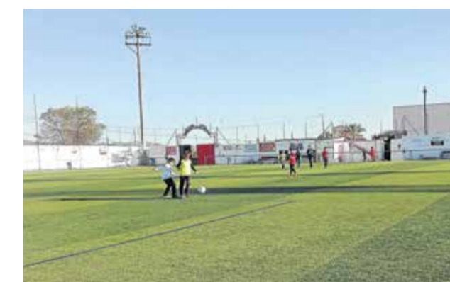
Campo de fútbol de La Portilla

El Ayuntamiento de Cuevas del Almanzora ha conseguido una subvención de 200.000 euros para mejorar el Campo Municipal de Fútbol 'Andrés Soler Guerrero', ubicado en La Portilla.