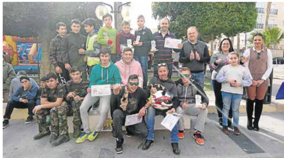
Participantes en el XIII Descenso de Karts Artesanales Sin Motor

La Navidad llegó a Cuevas y a todas sus pedanías en forma de luces, árboles y belenes, pero también, en forma de talleres navideños, de nieve y de actividades para los más pequeños y no tan pequeños de las barriadas de la localidad. La época de Pascua olió especial gracias a, entre otras cosas, un gran Nacimiento de Playmobil en el Huerto García Alix, un árbol de 43 metros diseñado y ejecutado por Fran Guevara y su equipo de Instelnet, y a la ilusión que desprendieron los niños cuevanos que en sus propias pedanías vieron llegar a Papá Noel, a la nieve y a los múltiples talleres que les enseñaron a convivir y a disfrutar mientras aprendían valores sociales. También hubo tiempo para los mayores a los que los concejales del Ayuntamiento visitaron en la residencia de ancianos y el centro de día para cantar villancicos y pasar un buen rato con ellos.