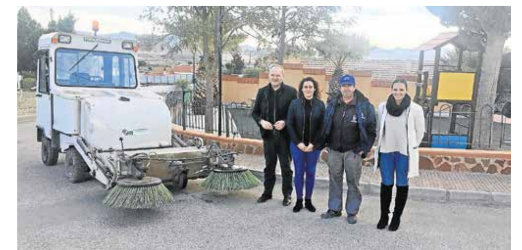
Nueva máquina para las pedanías

De esta forma, esta nueva máquina se añade a las que ya se utilizan para la brigada de Obras y Servicios con el fin de llevar a cabo de la forma más eficaz las tareas de limpieza.