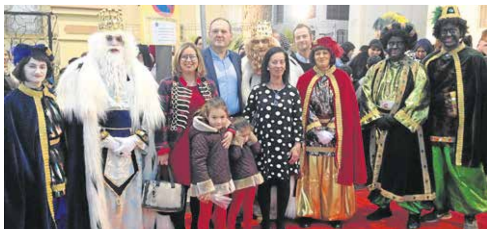
Los Reyes Magos llenaron de ilusión la noche cuevana