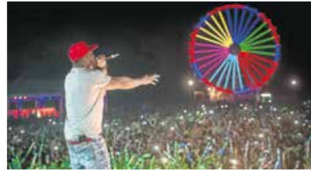
Dreambeach Villaricos 2017

Dreambeach Villaricos ha elevado varios peldaños el listón de calidad de su sexta edición con un avance de cartel rebotante de sofisticación y sorpresas.