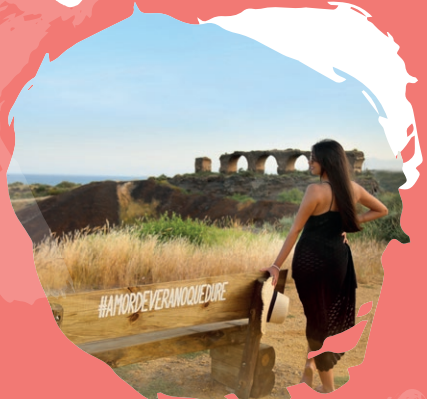
6 Cala La Invencible