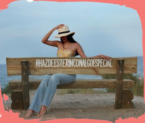
14 Cala Las Dos Hermanas