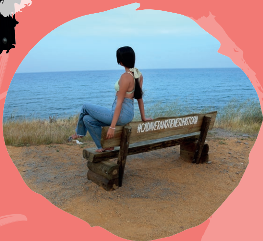
15 Mirador de El Calón