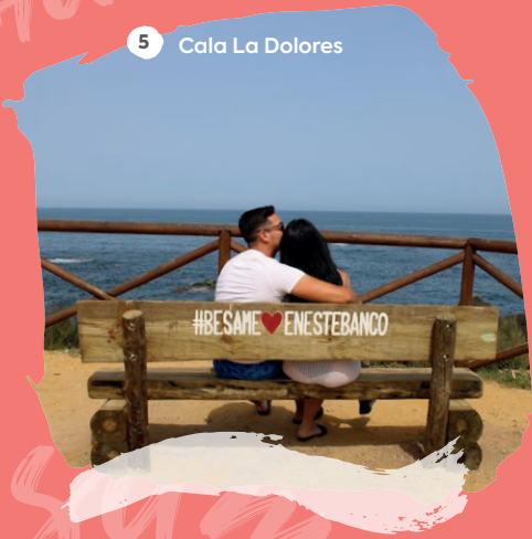
5 Cala La Dolores