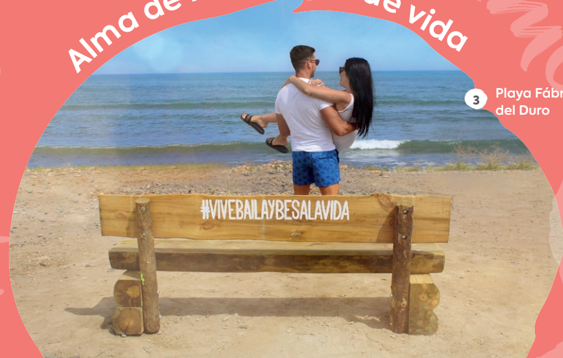
3 Playa Fábrica del Duro