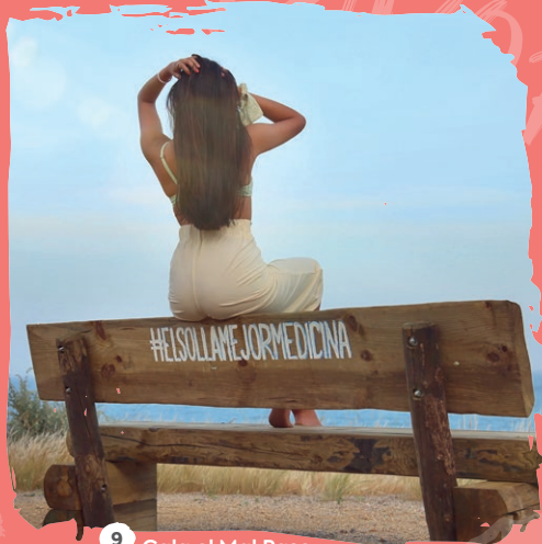
9 Cala el Mal Paso