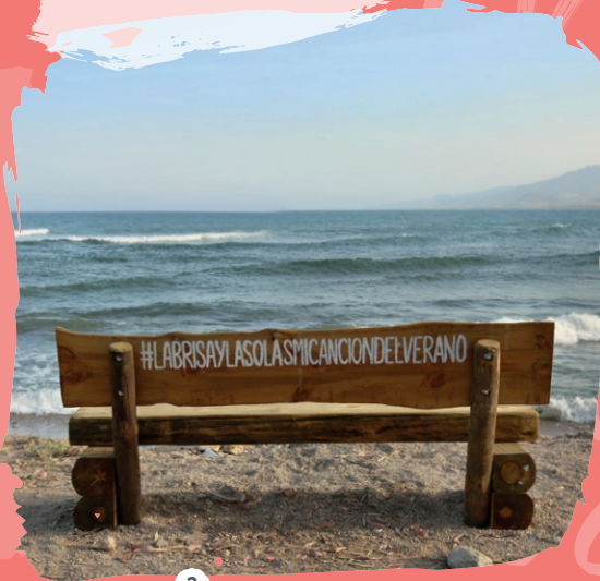
2 Bosque de Palomares