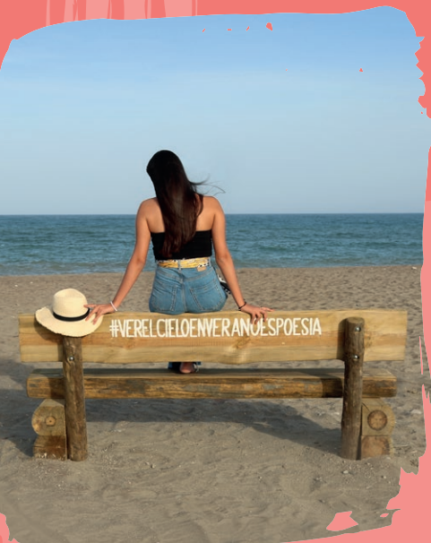
1 Playa de Quitapellejos

Descubre todo el mobiliario fotográfico que se ubica en nuestra costa