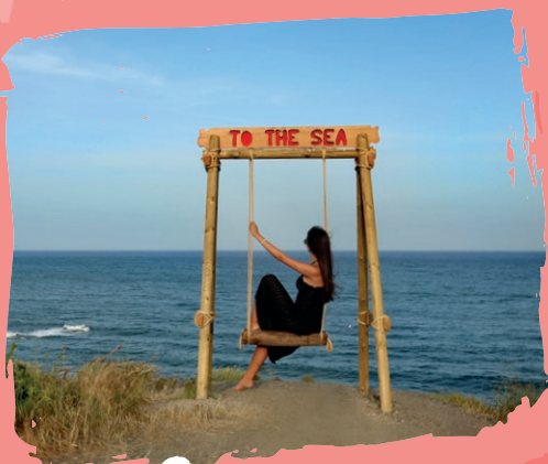
7 Cala La Invencible